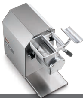
GF HP 4