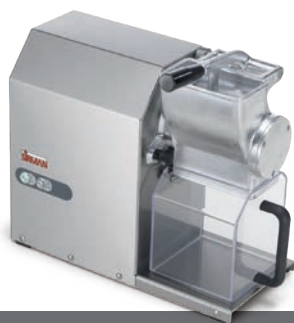
GFX HP 1,5