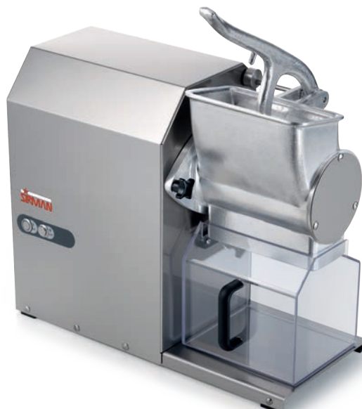
GFX HP 2

IP 67 protection rate 24V controls. Motor break. Safety microswitches on lever and receiving tray.